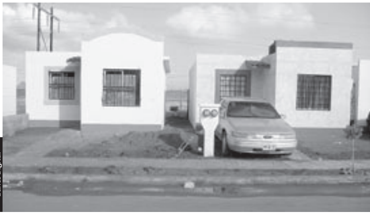
En el sector vivienda la recuperación se ha visto frenada en el primer semestre del 2010.

Ha habido un incremento en los materiales para la construcción de viviendas, que aunque no ha sido alto sí se ha elevado el principal insumo que es el cemento, mencionó, que ha tenido variaciones que impactan la actividad.