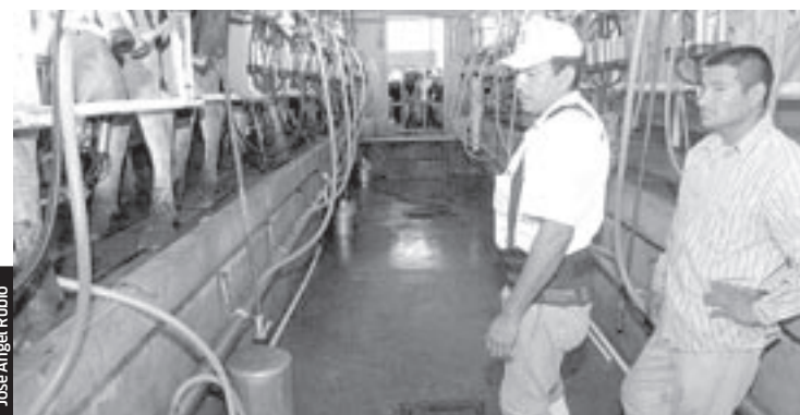
Invertirán más de 10 millones de pesos en la cuenca lechera de Suaqui Grande-Mátape, con lo que se modernizará el proceso de ordeña y se incrementará la producción de leche.