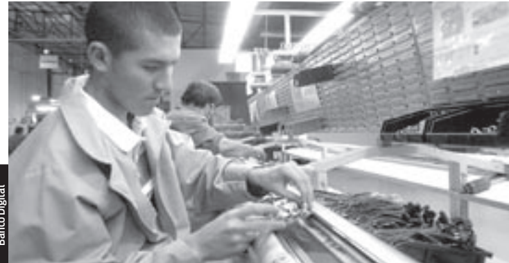
Las exportaciones manufactureras siguen con un ritmo acelerado de crecimiento.